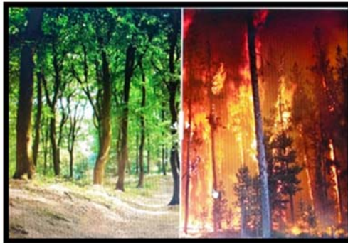
Εικόνα1. Αντιπαραβολή εικόνων

Όταν βρεθούν ξανά στην ψηφιακή τάξη, η διδασκαλία του θέματος συνεχίζεται αξιοποιώντας το εργαλείο αντιπαραβολής εικόνων της e-me content {image Juxtaposition} το οποίο δίνει τη δυνατότητα στους μαθητές να συγκρίνουν δυναμικά δύο εικόνες. Οι εικόνες που παρουσιάζονται αφορούν αντίθετες εκδοχές ενός υγιούς δάσους και ενός δάσους που φλέγεται (Εικόνα 1). Τα παιδιά ενθαρρύνονται να συμμετέχουν στο σχολιασμό των εικόνων προκειμένου να εντοπίσουν κοινά σημεία ανάμεσα στις δύο οπτικές πληροφορίες που συγκεντρώνουν μέσα από τη διαδικασία της προσεκτικής παρατήρησης. Ενδεικτικές ερωτήσεις που μπορεί να τεθούν είναι: τι ακριβώς συνδέει αυτές τις εικόνες, υπάρχουν στοιχεία που μοιάζουν, σε τι διαφέρουν, πώς μπορεί να άναψε η φωτιά, τι συμβαίνει σε ένα δάσος όταν καίγεται, ποιοι κινδυνεύουν, ποια εικόνα προτιμάς να αντικρίζεις, τι συναισθήματα σου δημιουργεί η κάθε εικόνα, ποια λύση θα μπορούσε να βρεθεί.