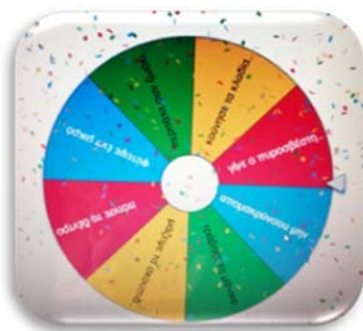
Εικόνα 2. Τροχός της τύχης

Την επόμενη ημέρα, στο εξ αποστάσεως μάθημα, έχει προσκληθεί (διαδικτυακά) ένας πυροσβέστης για να μιλήσει στα παιδιά για τη δουλειά του, να δείξει τον εξοπλισμό του, να μας περιγράψει τις εμπειρίες του από την κατάσβεση πυρκαγιάς και να δεχτεί τις ερωτήσεις των παιδιών. Ακολουθεί η προβολή εκπαιδευτικού βίντεο (YouTube kids) του πυροσβεστικού μουσείου με τίτλο “πρόληψη πυρκαγιών στο δάσος”. Μία από τις προτάσεις για την επίλυση του προβλήματος των καμένων δασών που αποφασίστηκε σε προηγούμενη δραστηριότητα είναι η αναδάσωση. Για την κατανόηση της έννοιας η νηπιαγωγός διαβάζει το παραμύθι "Αναδάσωση μαζί" (Ηλιοπούλος, 2008), και αφού το αναλύσουν μέσα από διαλογική συζήτηση, ακολουθεί μια δραστηριότητα που ενισχύει τον παιγνιώδη χαρακτήρα της μάθησης στο νηπιαγωγείο και είναι ένα κινητικό παιχνίδι. Το εργαλείο που χρησιμοποιείται είναι “το wheel of names” (εικόνα 2) όπου πρόκειται για έναν τροχό που γυρίζει με το πάτημα ενός κουμπιού κ κάθε φορά σταματά τυχαία σε μια καρτέλα του, παρουσιάζοντας μια εικόνα ή μία οδηγία την οποία τα παιδιά καλούνται να εκτελέσουν {π.χ. περπάτα σαν ζωάκι του δάσους ή κούνησε τα κλαδιά σου σαν δεντράκι ή απομακρύνσου μην σε φτάσει η φωτιά ή γίνε πυροσβέστης που σβήνει τη φωτιά κ.α.}. Το παιχνίδι παρουσιάζεται από το διαδίκτυο με διαμοιρασμό οθόνης μέσω Webex σε όλα τα παιδιά.